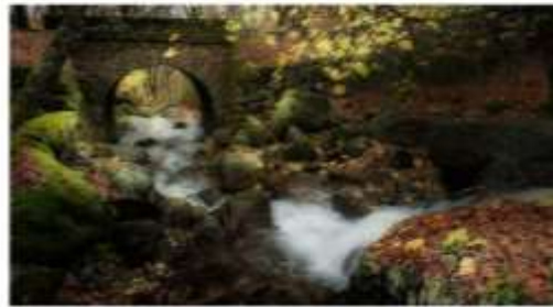
Un paisaje de un río, con los árboles de un color rojo brillante en un momento de la mañana, en el Valle del Ambroz

En el Centro-Sur participen los actos más habituales de los ocho pueblos que conforman el Valle del Ambroz